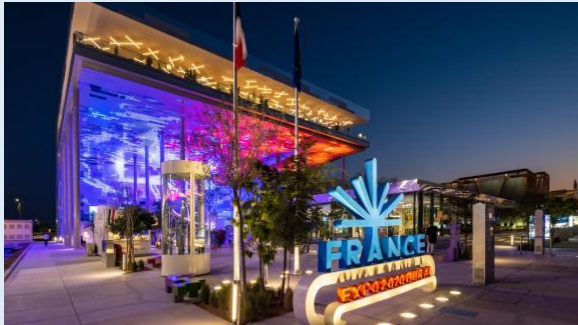
Le Pavillon France à l'Exposition universelle

L'exposition universelle se déroule du 1 er octobre au 31 mars aux Emirats arabes unis avec pour thème principal : « Connecter les esprits, Construire le futur »