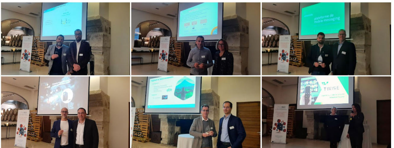
Les lauréats et remettants lors de la Cérémonie des Trophées SCS 2022