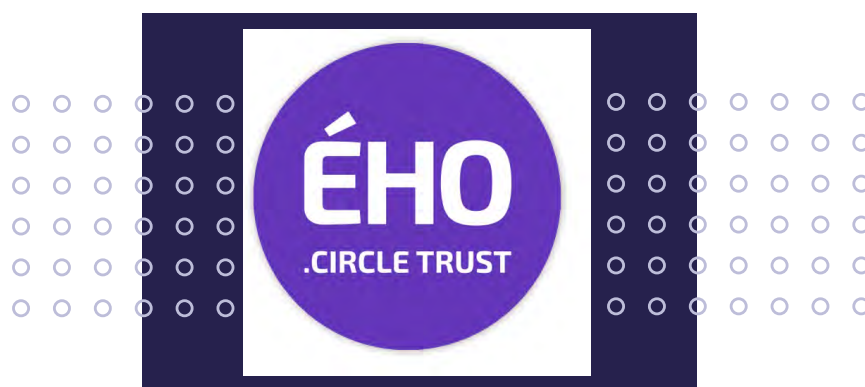
Logo Ého.CircleTrust

Contact presse : Samantha MATCHETT - 04 84 89 43 10 - samantha.matchett@eho.link